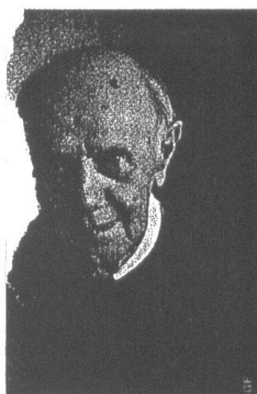
JOSSE DE PAUW

Zoals we de aanpak van Josse De Pauw kennen, wordt het allicht geen eenduidig verhaal waarbij het publiek aan het handje wordt genomen. 'Het zal een open voorstelling zijn, waarbij het publiek wordt uitgenodigd om zelf verbanden te leggen.