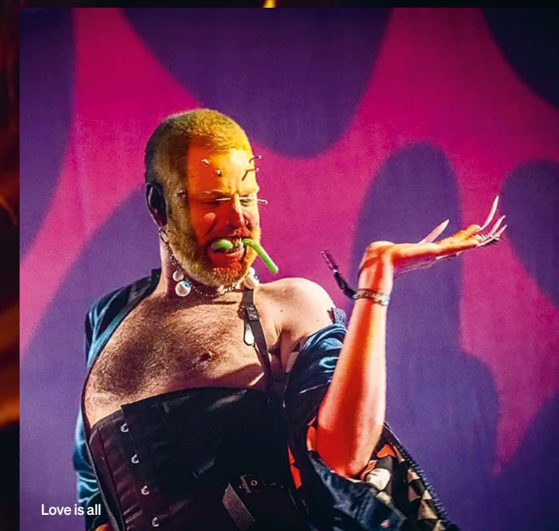
Love is all