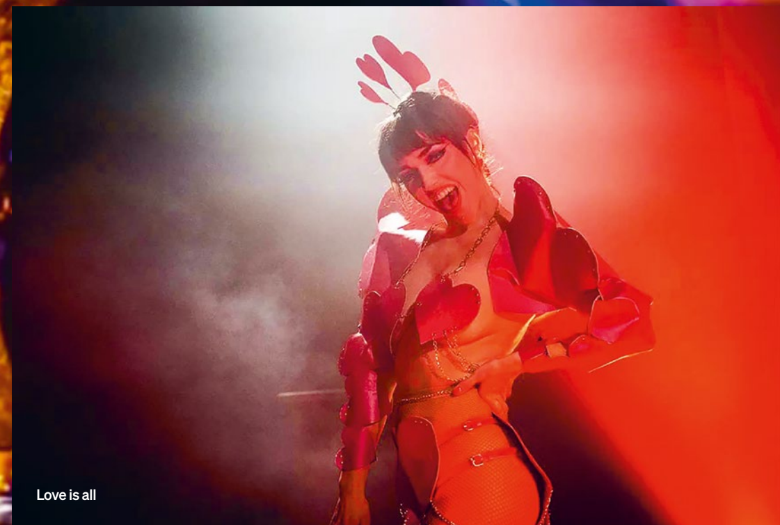
Love is all