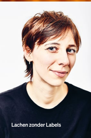
Lachen zonder Labels