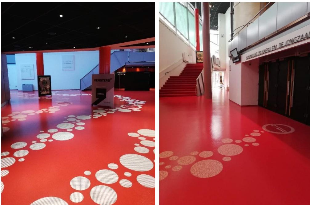
De stippen op de vloer geven de routes aan naar de theaterzalen. Als cinemabezoeker hoef je hier niet op te letten.

Je loopt dan via de garderobe naar beneden, terug naar het entreegebied. Daar loop je de foyer in. Je gaat hier linksom, langs de ingang van de Koninklijke Drukkerij E.M. De Jongzaal. Achterin vind je de ingang van Vensters'.